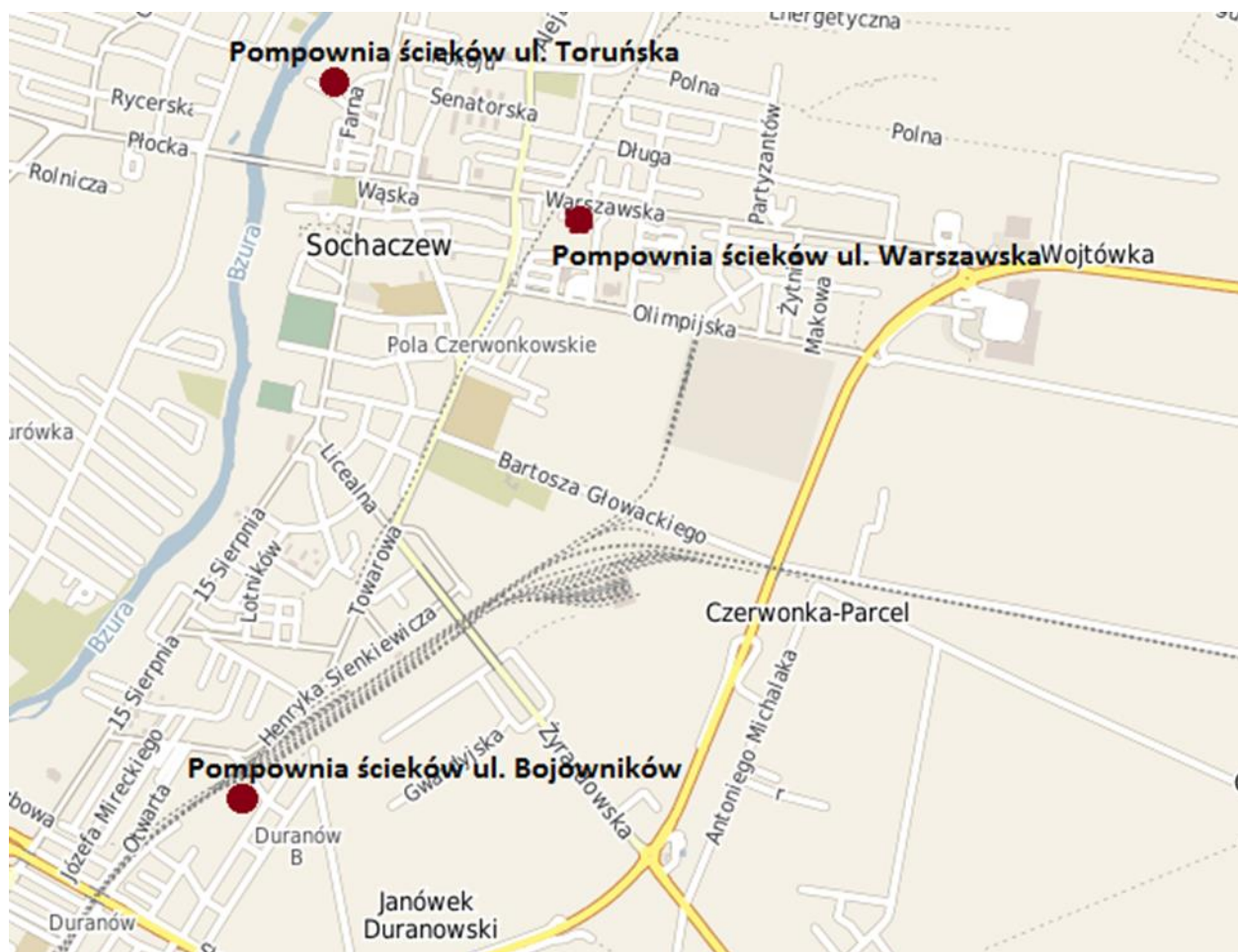
Lokalizacja pompowni ścieków dla których prowadzono roboty w ramach Kontraktu nr 6.