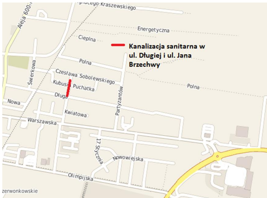
Lokalizacja przyłączy kanalizacji sanitarnej wybudowanych i przebudowanych w ul. Długiej i ul. Jana Brzechwy w ramach Kontraktu nr 8.