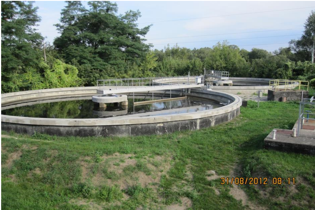
Osadniki wtórne - Miejska Oczyszczalnia Ścieków w Sochaczewie