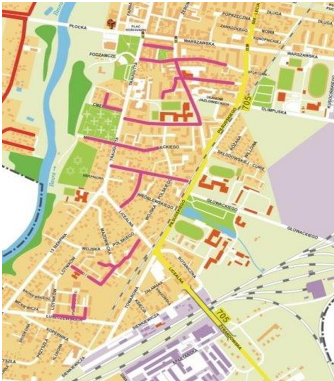
Przebieg sieci kanalizacji sanitarnej zmodernizowanej w ramach Kontraktu nr 4.