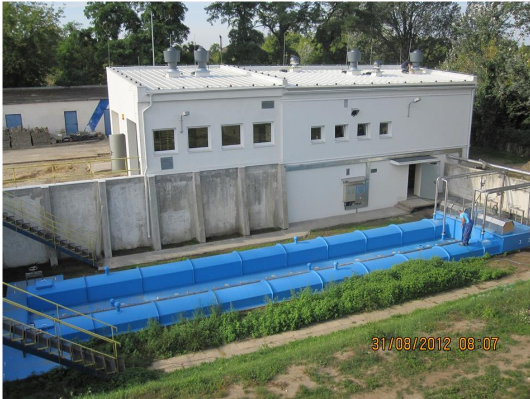
Piaskownik - Miejska Oczyszczalnia Ścieków w Sochaczewie