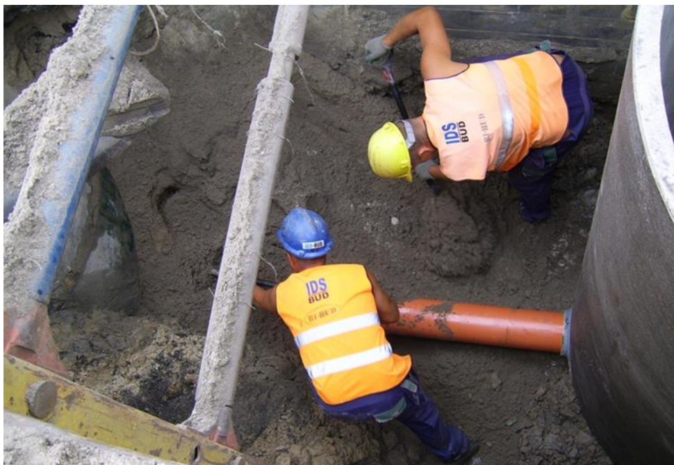
Prace przy budowie kanalizacji sanitarnej