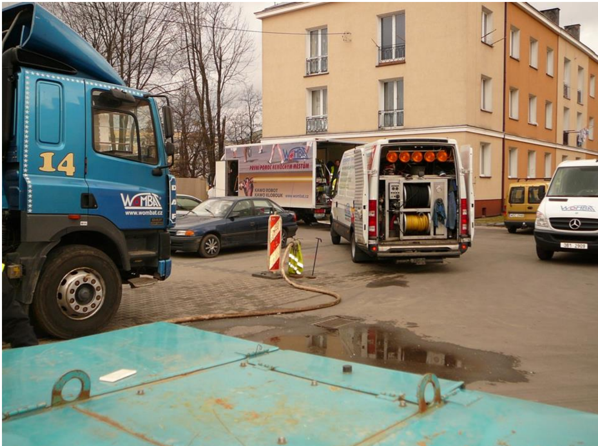
Modernizacja sieci kanalizacji sanitarnej na ul. Dywizjonu 303