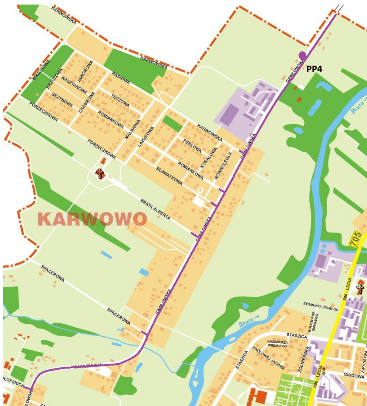
Trasa sieci kanalizacji sanitarnej i lokalizacja przepompowni wybudowanych w ramach Kontraktu nr 2a.