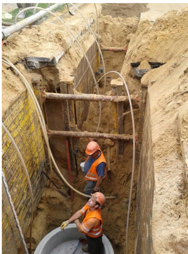
Budowa kanalizacji sanitarnej w ul. Parkowej