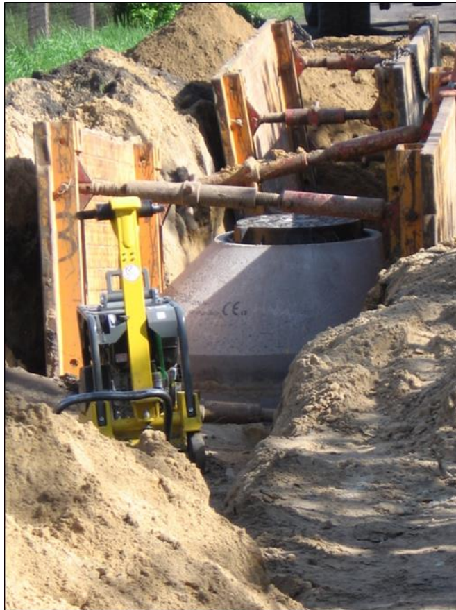
Budowa kanalizacji sanitarnej w ul. Iwaszkiewicza