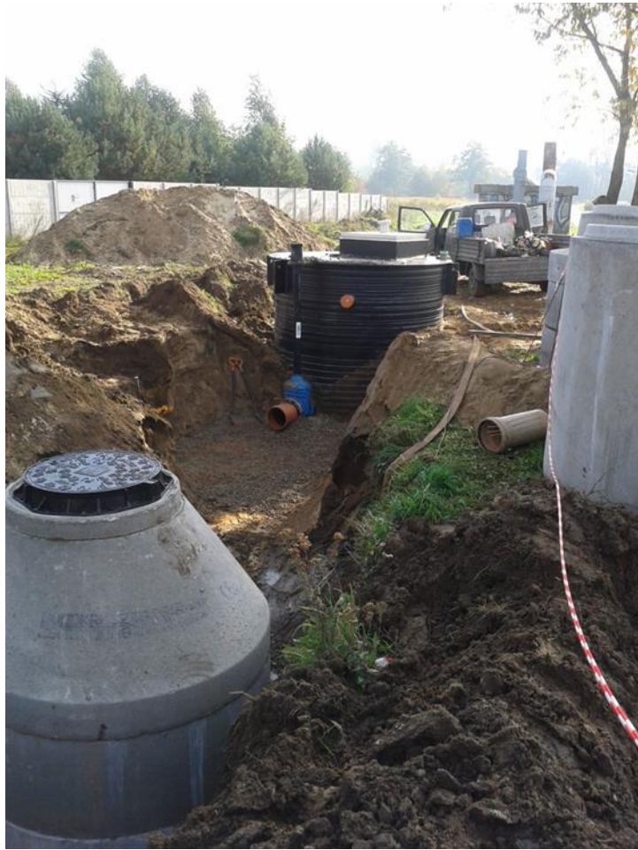
Budowa tłocznia PP1 w Karwowie