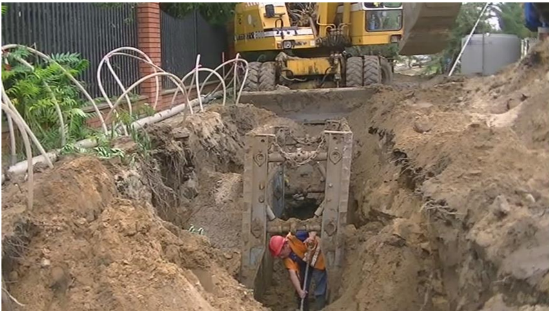
Budowa kanalizacji sanitarnej w ul. Rozłazłowskiej - PP12