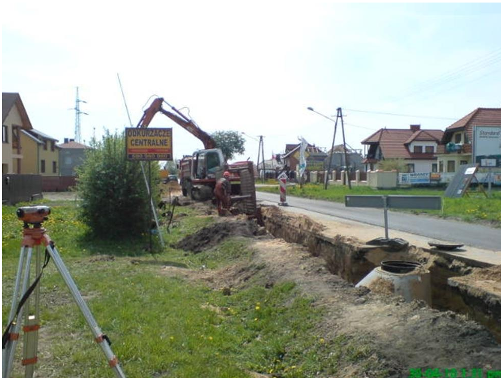
Budowa kanalizacji sanitarnej w ul. Gawłowskiej