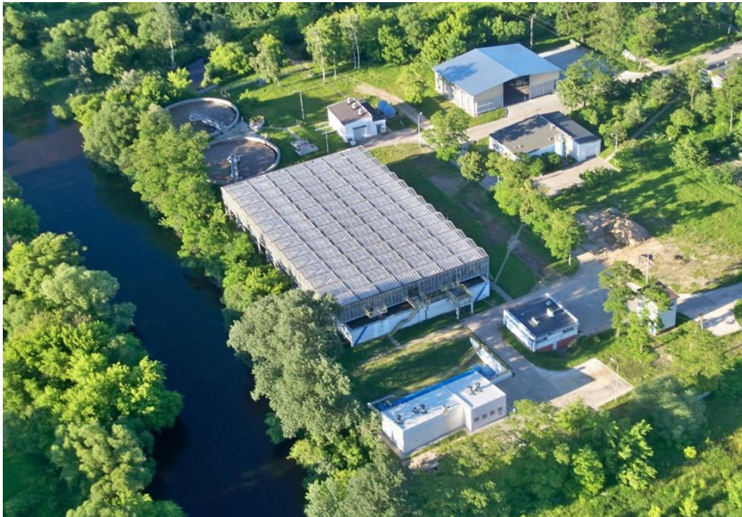
Widok z lotu ptaka na Miejską Oczyszczalnię Ścieków w Sochaczewie