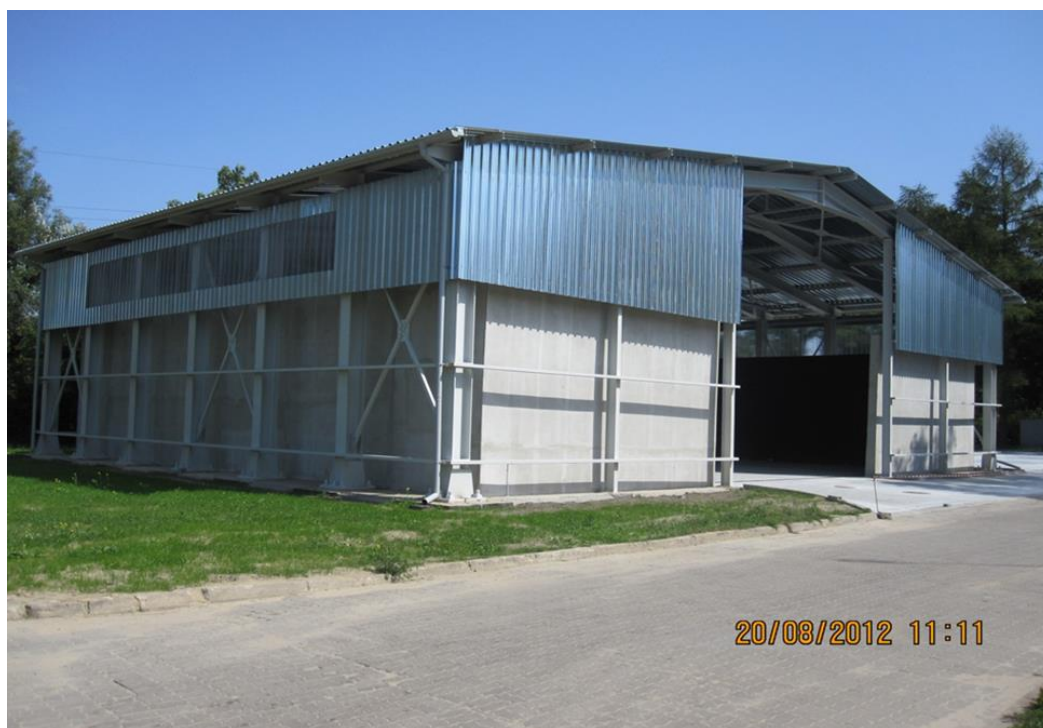
Wiata z placem składowania - Miejska Oczyszczalnia Ścieków w Sochaczewie