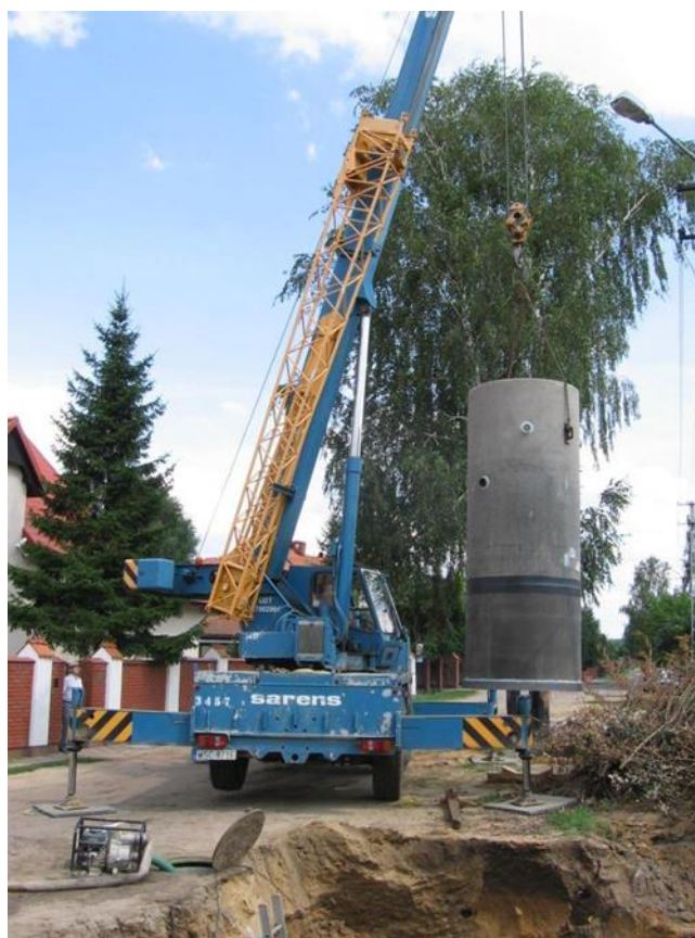
Budowa przepompowni ścieków - PP28 w ul. Asnyka