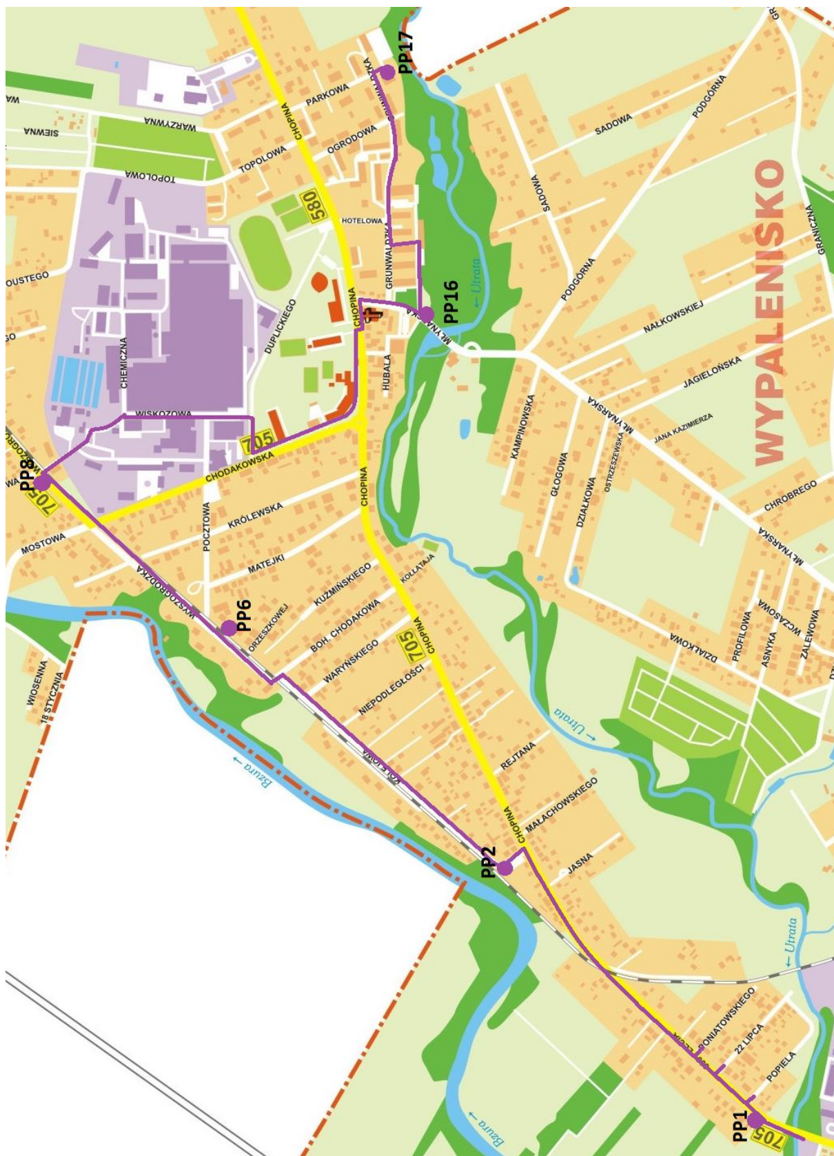
Przebieg sieci kanalizacji sanitarnej i rozmieszczenie pompowni wybudowanych w ramach Kontraktu nr 3a.