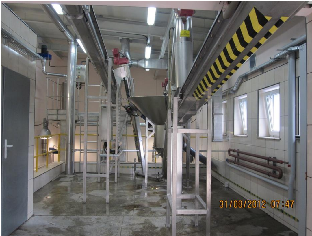
Wnętrze budynku krat - Miejska Oczyszczalnia Ścieków w Sochaczewie