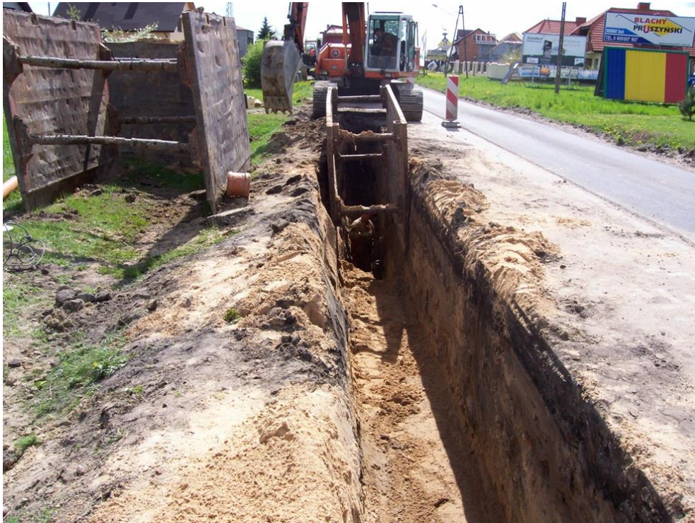
Budowa kanalizacji sanitarnej w ul. Gawłowskiej